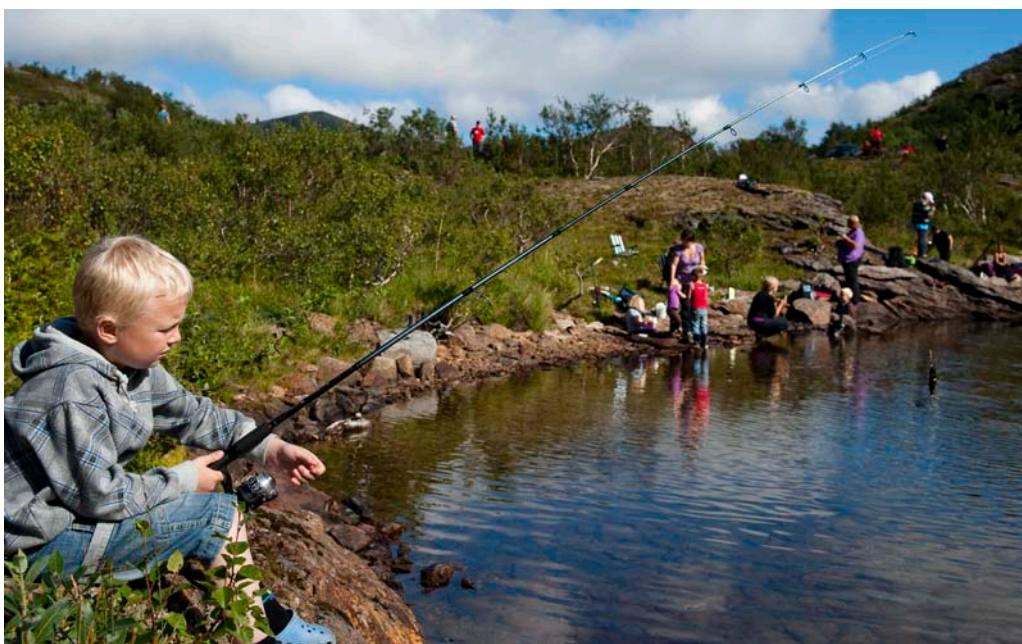
Utprøving av ny fiskestang