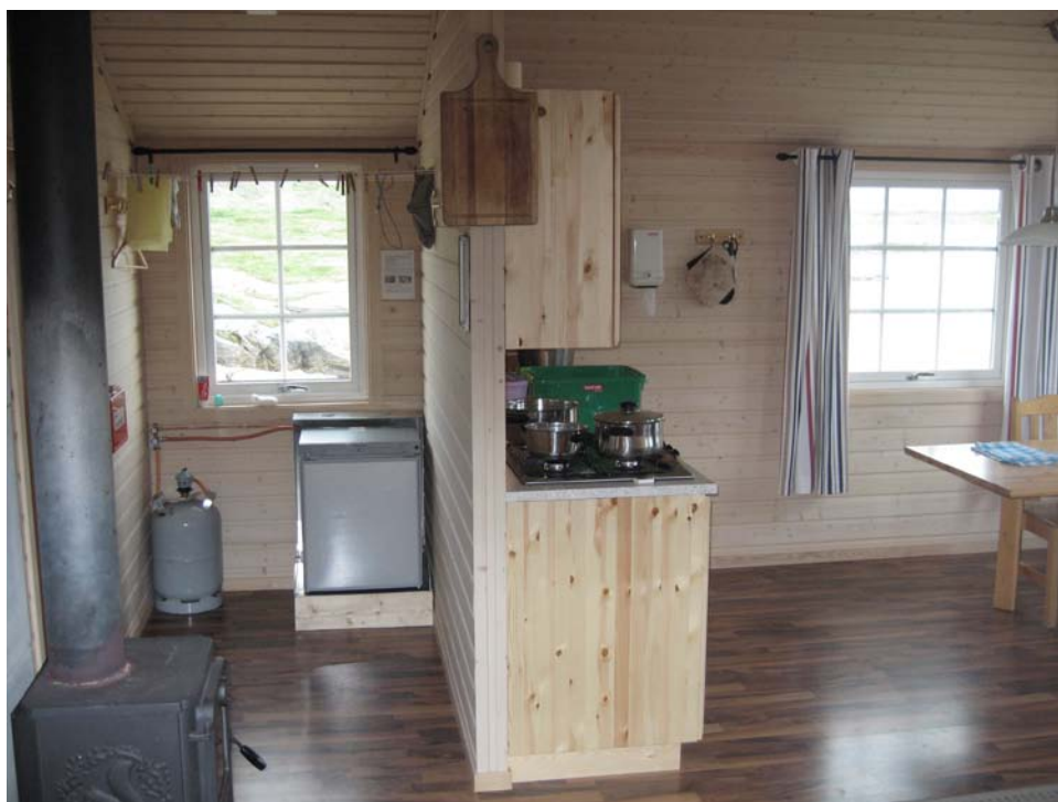
Fiskvann: "Nyhytta" med gasskjøleskap

Det er kjøpt inn gasskjøleskap til Gåsvann, Svalvann, Fiskvann og Sundvann. Dette for å sikre god mulighet for oppbevaring av mat på sommeren. Foreløpig er dette permanent oppmontert på Fiskvann og midlertidig på de 3 andre Sundvann, Gåsvann og Svalvann. Permanent montasje for disse 3 hyttene gjøres vinteren 2011.