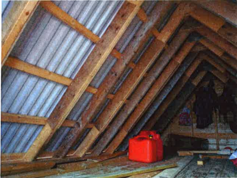
Bilde nye sperrer + lasker eksisterende sperrer

I begynnelsen av juni ble det kjørt opp nye sperrer samt lasker for de øvrige sperrene. Det ble satt inn 4 ekstra sperrer samt at de gamle sperrene ble forsterket med forsterket med lasker.